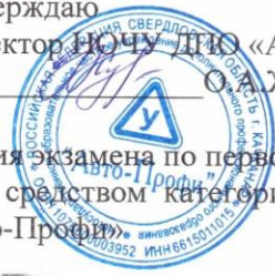
Схема закрытой площадки для проведения экзамена по первоначальным навыкам управления транспортным средством категории «В» НОЧУ ДПО «Авто-Профи»

Утверждаю Директор НОЧУ ДПО «Авто-Профи» Журавлева